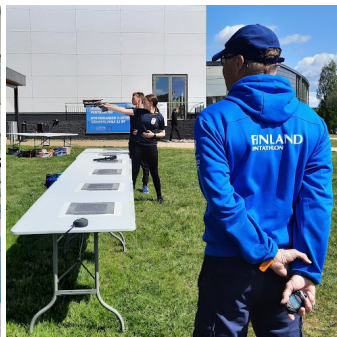
Jokke on luotsannut seuran ottelijoita hyvin suorituksiin niin treeneissä kuin kisoissa.