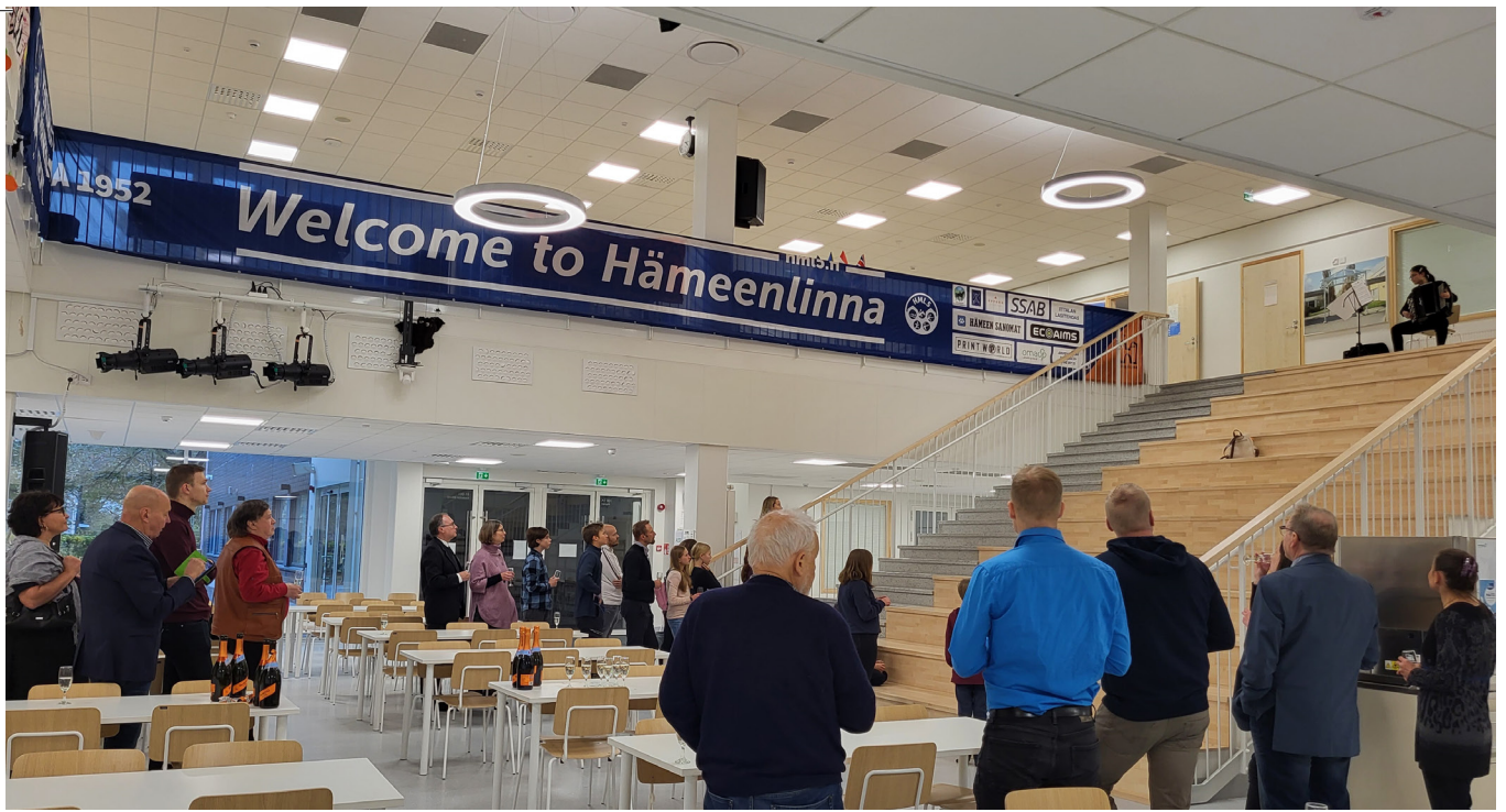
Vieraat kuuntelemassa musiikkiesitystä.