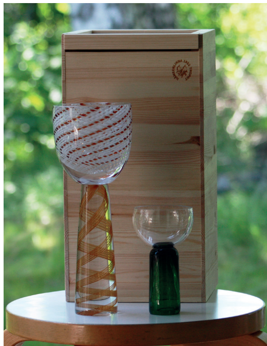
Pentathlon Hämeenlinna 1952 Trophy -lasipokaali on litalan lasitehtaan ja Tavastian opiskelijoiden käsialaa.