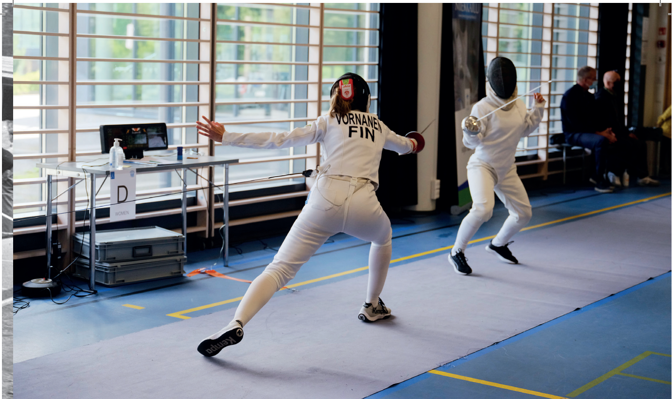
Monista sääntömuutoksista huolimatta miekkailu on säilyttänyt perinteisen perusluonteensa.

mäksi. Maastoratsastus on muutettu turvallisempaan esteratsastukseen. Vapaauintimatkaa on lyhennetty. Miekkailun ottelu-aikaa on lyhennetty. Viimeisimpänä uudistuksena ammunta ja juoksu yhdistettiin vuonna 2010 ja seuraavana vuonna siirryttiin ilmapistoolista turvalliseen ja ekologiseen laserammuntaan (Laser Run). Nykyaikaisessa viisiottelussa saavutettu tulos tai aika muunnetaan pisteiksi, eri lajeissa erilaisilla kertoimilla. Nykyaikainen 5-ottelu on monipuolinen laji, jota voi harrastaa 7-vuotiaasta jopa 80 vuoden ikään saakka.