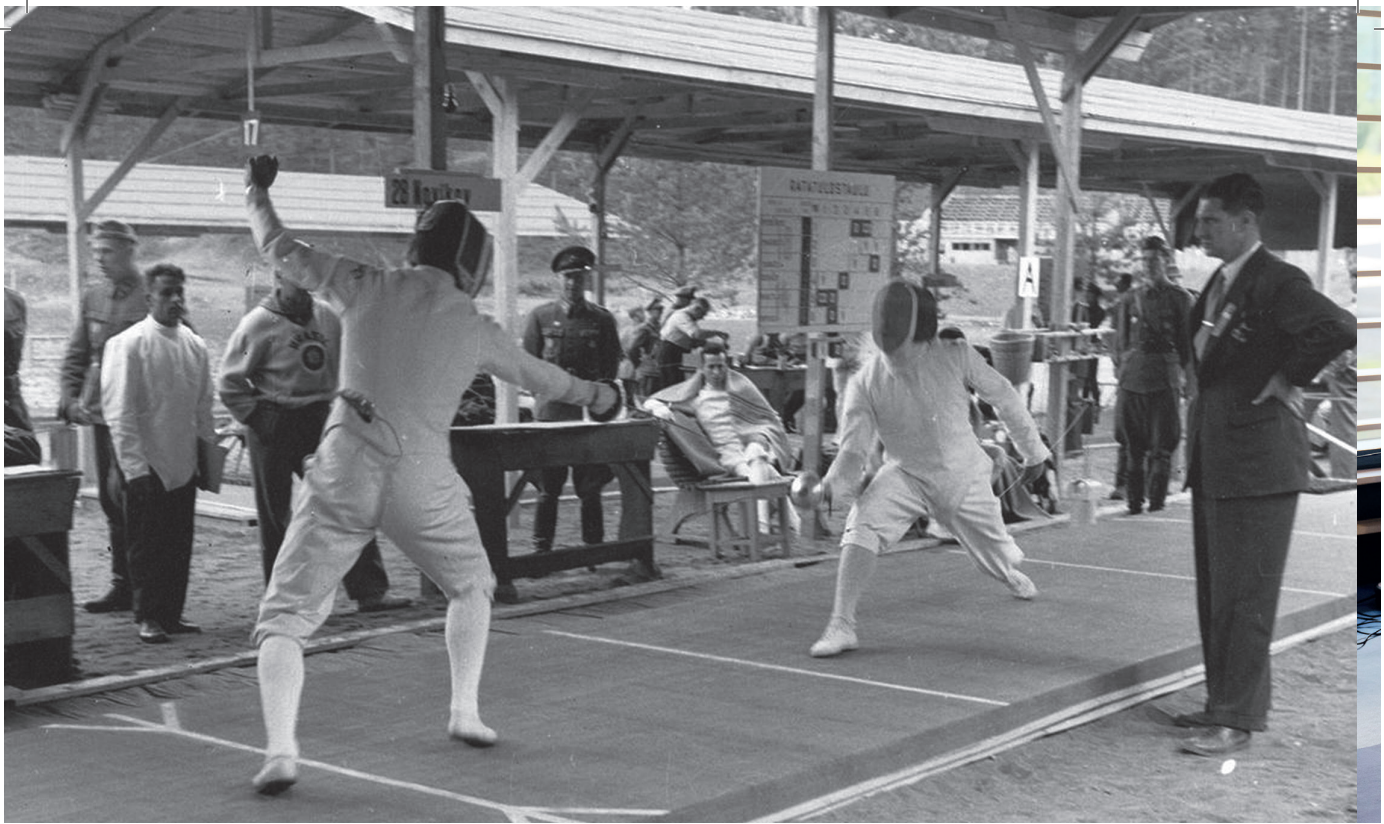
Hämeenlinnan olympiaviisiottelun miekkailu järjestettiin Ahvenistolla tilapäisillä katetuilla radoilla.